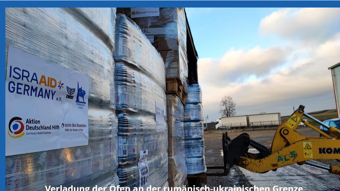
Verladung der Ofen an der rumänisch-ukrainischen Grenze

Das Jahr 2022 war natürlich auch für uns von dem Kriegsausbruch am 24.02. in der Ukraine geprägt.